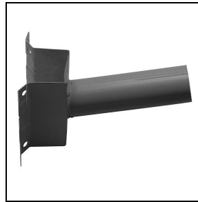
14077796 Gegalvaniseerde stalen wandsteun , met cataphorese polyester poeder afwerking AN-g6 / Antraciet

Om een constante actualisering van haar producten te bevorderen, behoudt PERFORMANCE IN LIGHTING zich het recht voor om zonder voorafgaande kennisgeving, wijzigingen aan te brengen. Daarom is het altijd aan te raden om de laatste versie te lezen die op de website www.performanceinlighting.com is gepubliceerd. Geleverde lumenoutput en stroomverbruik, inclusief verliezen, zijn onderhevig aan een tolerantie van +/-7%. Tenzij anders vermeld, gelden de waarden bij een omgevingstemperatuur van 25°C. De garantievoorwaarden zijn beschikbaar op https://www.performanceinlighting.com/qr/company/led-warranty