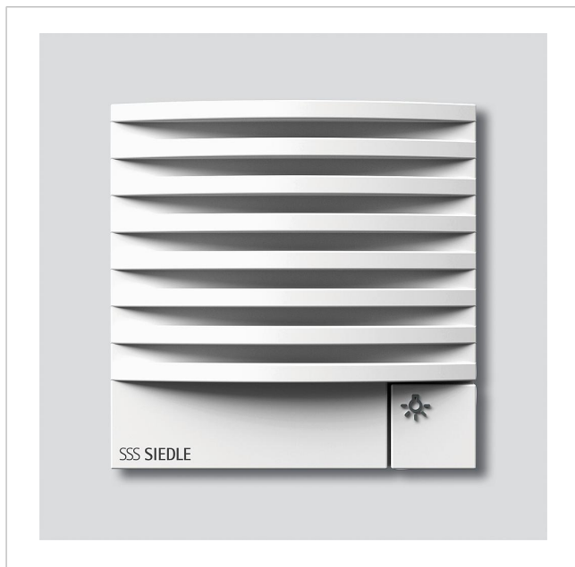
Access- deurluidsprekermodule Plus ATLM 671-0 W 210007344-00