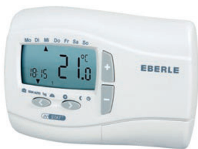
IN STAT+ 2R