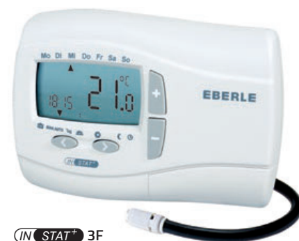
IN STAT+ 3F