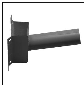
14077796 Gegalvaniseerde stalen wandsteun , met cataphorese polyester poeder afwerking ■ AN-g6 / Antraciet

Om een constante actualisering van haar producten te bevorderen, behoudt PERFORMANCE IN LIGHTING zich het recht voor om zonder voorafgaande kennisgeving, wijzigingen aan te brengen. Daarom is het altijd aan te raden om de laatste versie te lezen die op de website www.performanceinlighting.com is gepubliceerd. Geleverde lumenoutput en stroomverbruik, inclusief verliezen, zijn onderhevig aan een tolerantie van +/-7%. Tenzij anders vermeld, gelden de waarden bij een omgevingstemperatuur van 25°C. De garantievoorwaarden zijn beschikbaar op https://www.performanceinlighting.com/qr/company/led-warranty